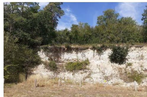
Front de taille calcaire