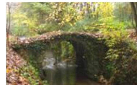
Pont de pierre