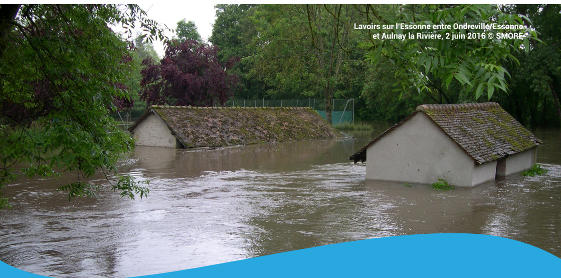
Lavoirs sur l'Essonne entre Ondreville/Essonne et Aulnay la Rivière, 2 juin 2016

Trois communes se sont engagées en Essonne (Saclas, Buno-Bonnevaux et La Ferté-Alais) et deux en Seine-et-Marne (Saint Germain-sur-École et Cély) dans des diagnostics de vulnérabilité de bâtiments publics mais aussi d'habitations privées afin d'aider les habitants à être plus résilients face aux inondations. Toutes les communes ont la possibilité de s'engager dans cette démarche de réduction de la vulnérabilité pour leurs citoyens et leurs bâtiments. Les diagnostics et les travaux peuvent être, en partie, financés par l'État, sous conditions ( developpement-durable.gouv.fr ).