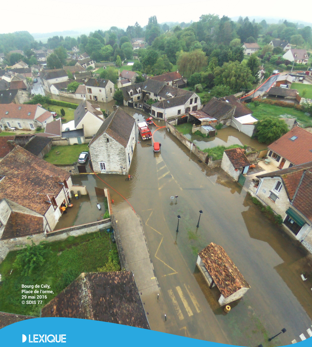
Bourg de Cély, Place de l'orme, 29 mai 2016