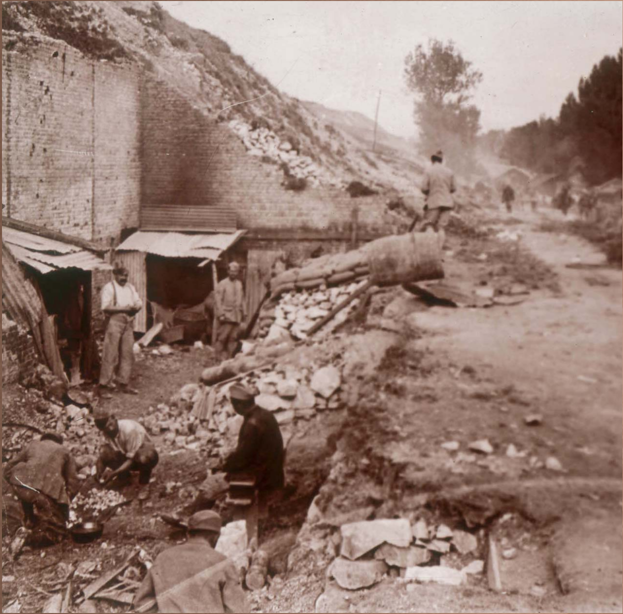
Le Campement de l'Eclusier-Vaux (Somme), sans date.