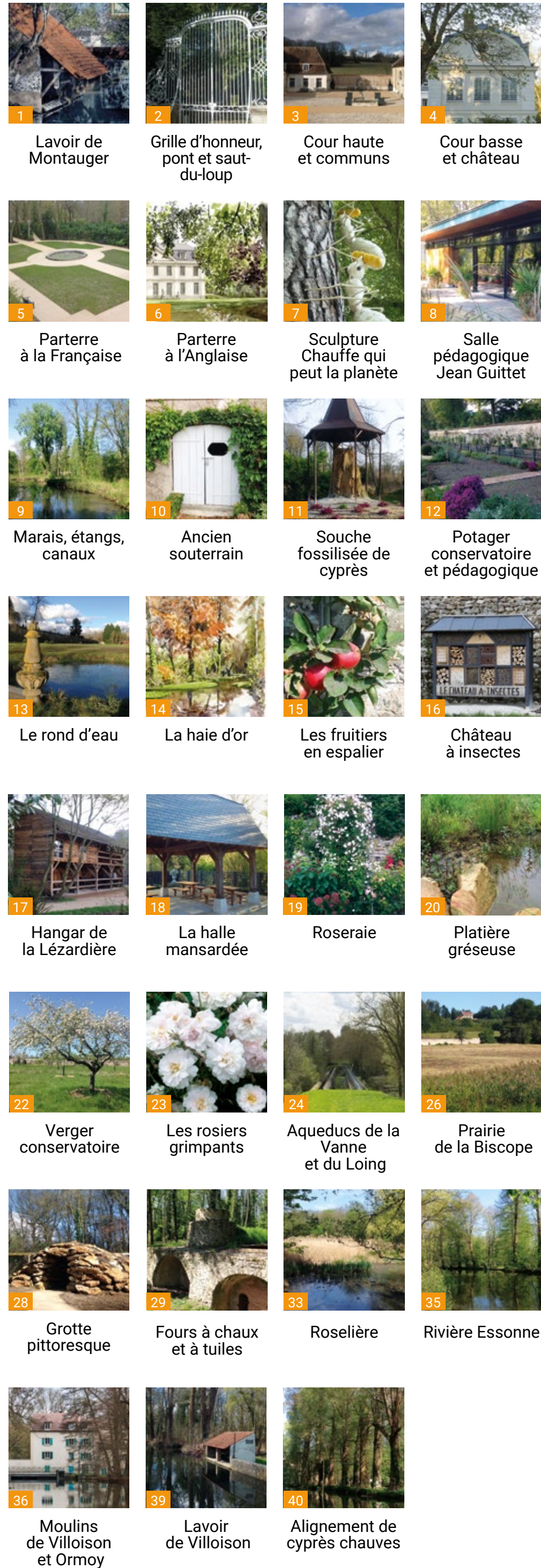
1 Lavoir de Montauger 2 Grille d'honneur, pont et saut-du-loup 3 Cour haute et communs 4 Cour basse et château 5 Parterre à la Française 6 Parterre à l'Anglaise 7 Sculpture Chauffe qui peut la planète 8 Salle pédagogique Jean Guittet 9 Marais, étangs, canaux 10 Ancien souterrain 11 Souche fossilisée de cyprès 12 Potager conservatoire et pédagogique 13 Le rond d'eau 14 La haie d'or 15 Les fruitiers en espalier 16 Château à insectes 17 Hangar de la Lézardière 18 La halle mansardée 19 Roseraie 20 Platière gréseuse 22 Verger conservatoire 23 Les rosiers grimpants 24 Aqueducs de la Vanne et du Loing 26 Prairie de la Biscope 28 Grotte pittoresque 29 Fours à chaux et à tuiles 33 Roselière 35 Rivière Essonne 36 Moulins de Villoison et Ormoy 39 Lavoir de Villoison 40 Alignement de cyprès chauves