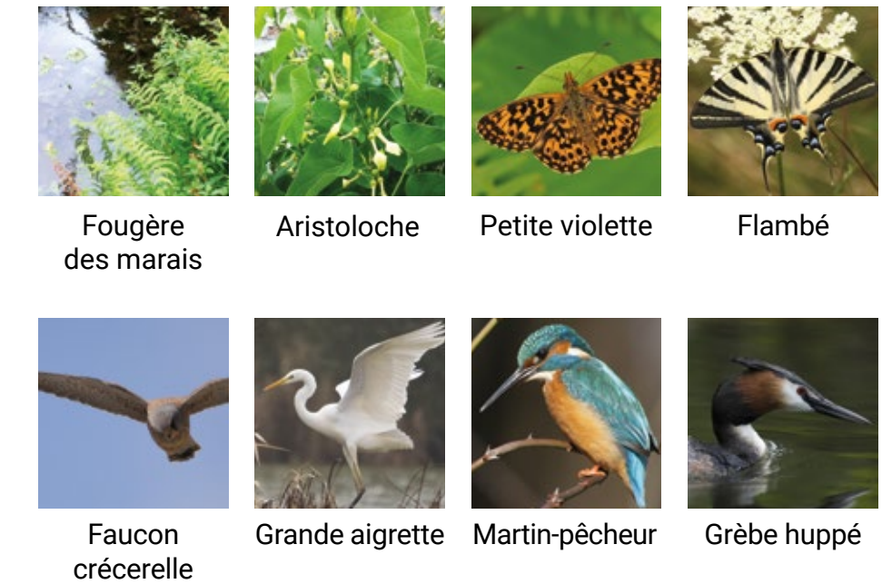
Fougère des marais Aristolochie Petite violette Flambé Faucon crécerelle Grande aigrette Martin-pêcheur Grèbe huppé